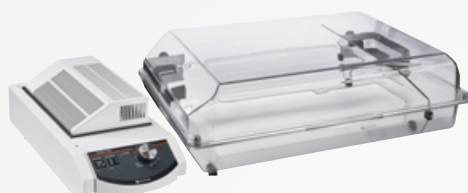
Modulares Inkubatorsystem 1000