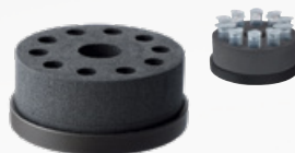
Haltegestell für 10 Reagenzgläser