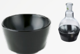
Großer Aufnahmeteller für 50 ml Rundkolben